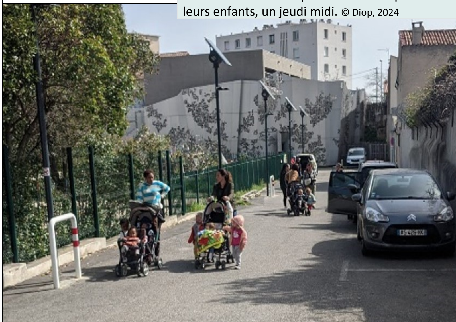
Retour des mamans qui viennent récupérer leurs enfants, un jeudi midi.