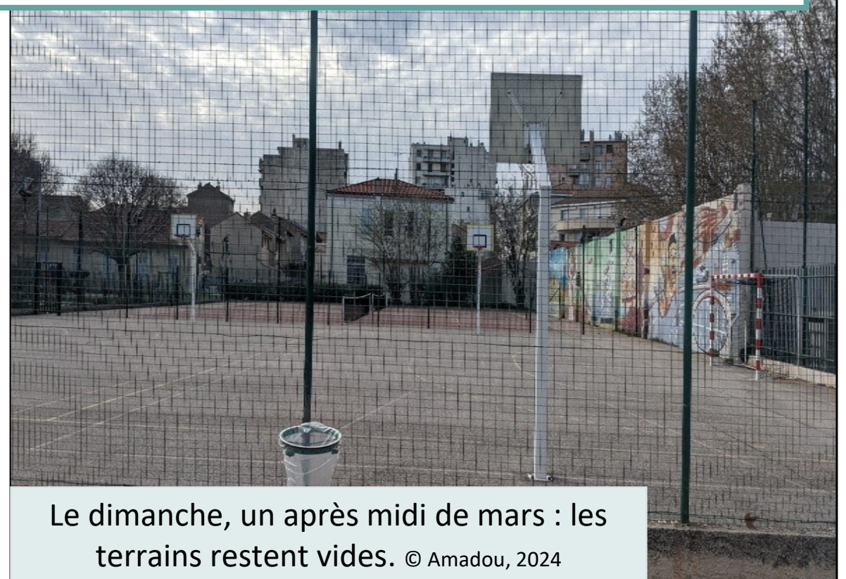
Le dimanche, un après midi de mars : les terrains restent vides.

Le lundi 18 mars, vers 17h00, je me rends sur le site Velten pour mon observation. En arrivant au portail qui mène au jardin, je le trouve encore ouvert, même s'il n'y a pas d'activité sur le site. J'y croise, juste au portail, un groupe de 7 adolescents, entre 13 et 16 ans : des garçons habillés en tenue de sport qui tiennent un ballon, et se hasardent sur le site. Ils semblent vouloir utiliser le terrain pour jouer. Ils glissent un œil, voient que tout est fermé, et rebroussement chemin en discutant entre eux. Extrait de carnet de terrain, Diop, mars 2024