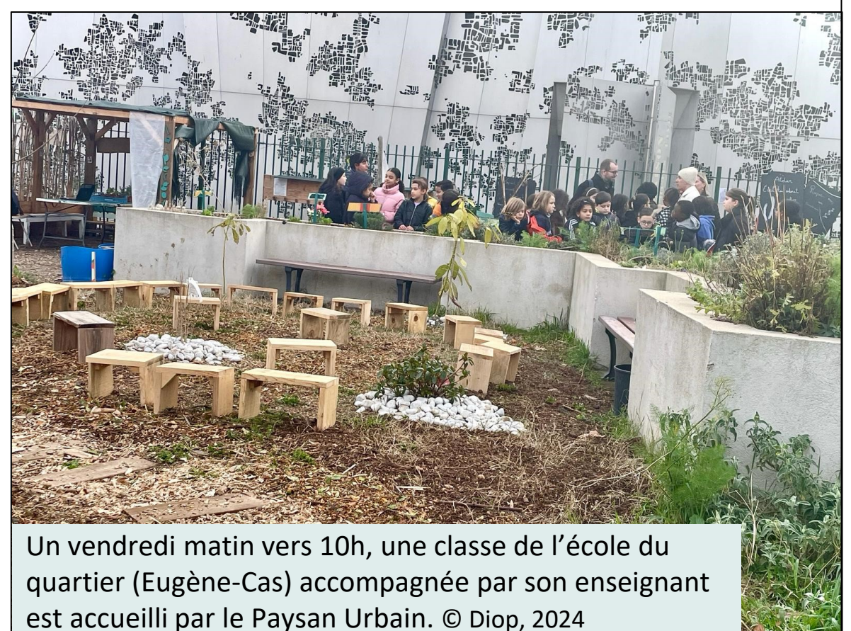
Un vendredi matin vers 10h, une classe de l'école du quartier (Eugène-Cas) accompagnée par son enseignant est accueillie par le Paysan Urbain.