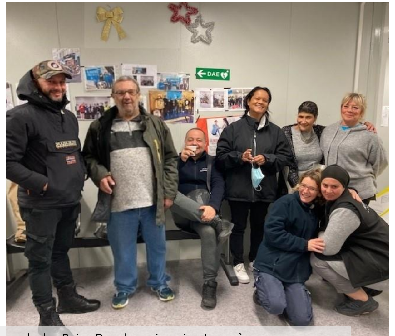
Personnels des Bains Douches, riverain et usagères